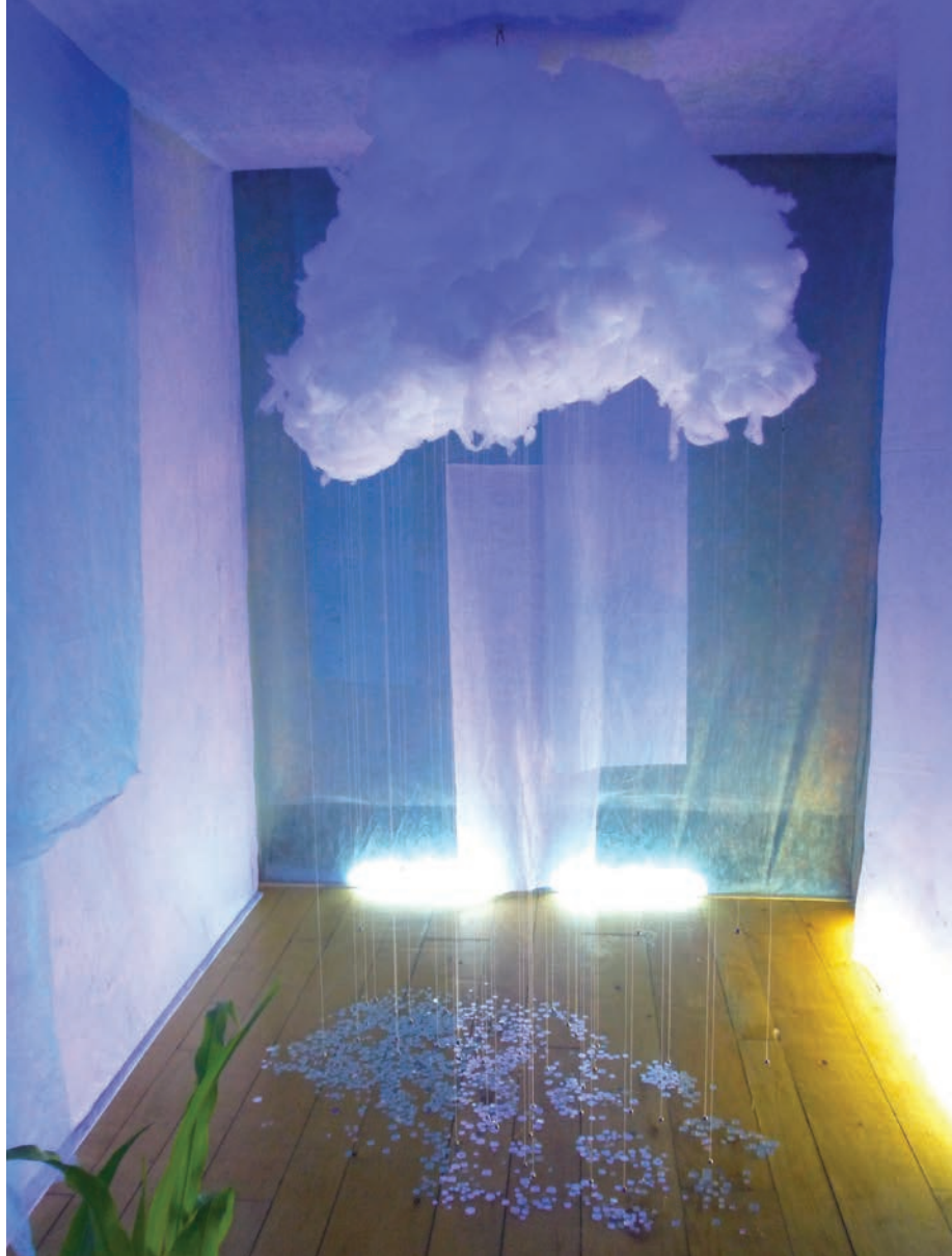
Installation sonore dans le pigeonnier