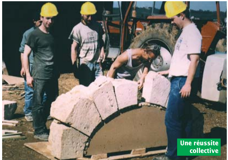
Une réussite collective