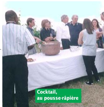
Cocktail, au pousse-râpière