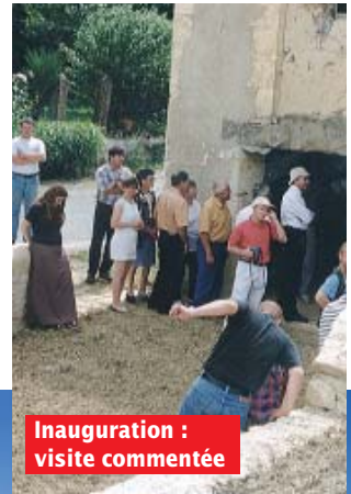
Inauguration : visite commentée