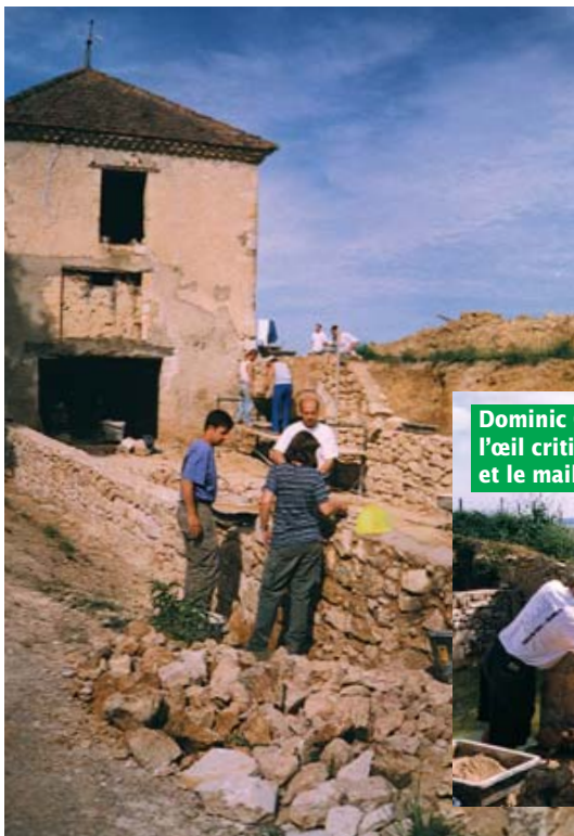
Dominic Goddard, l'œil critique et le maillot blanc