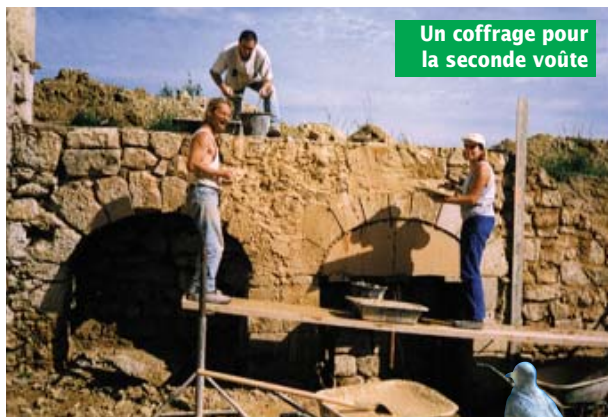
Un coffrage pour la seconde voûte