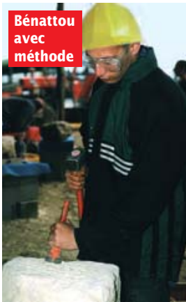
Bénattou avec méthode