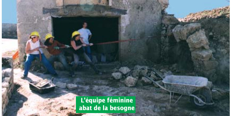
L'équipe féminine abat de la besogne