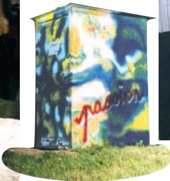
Tout faire avec passion