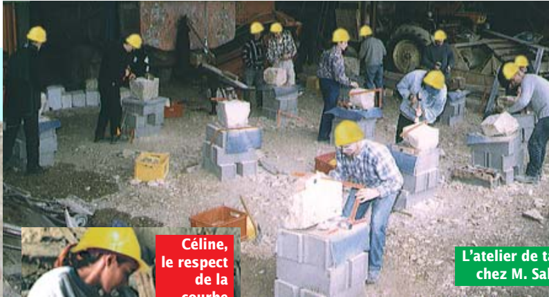
L'atelier de t... chez M. Sal...